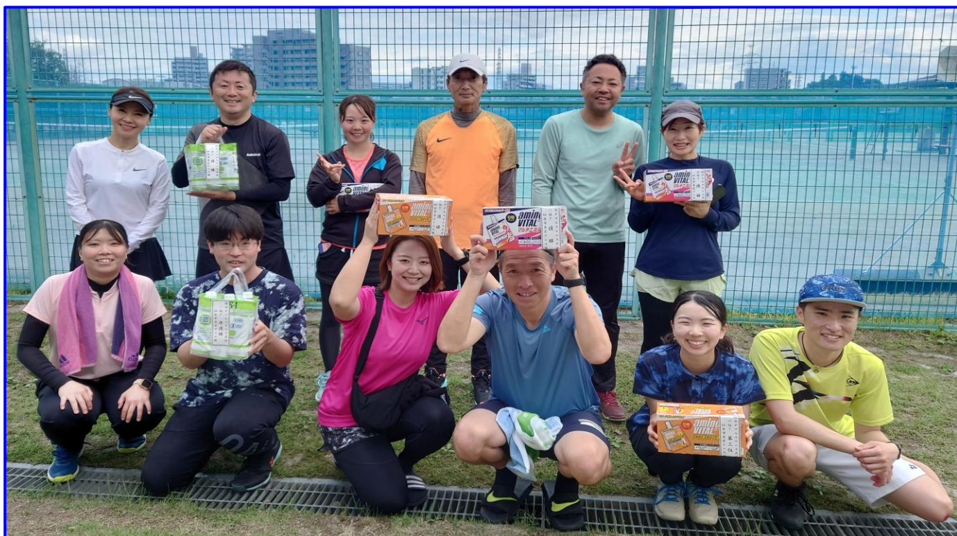
混合ダブルステニス大会 入賞者の皆様 ↑