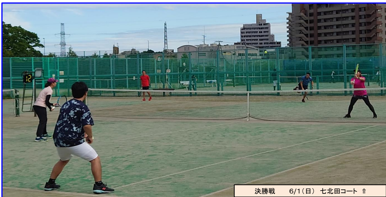
決勝戦 6/1(日) 七北田コート ↑